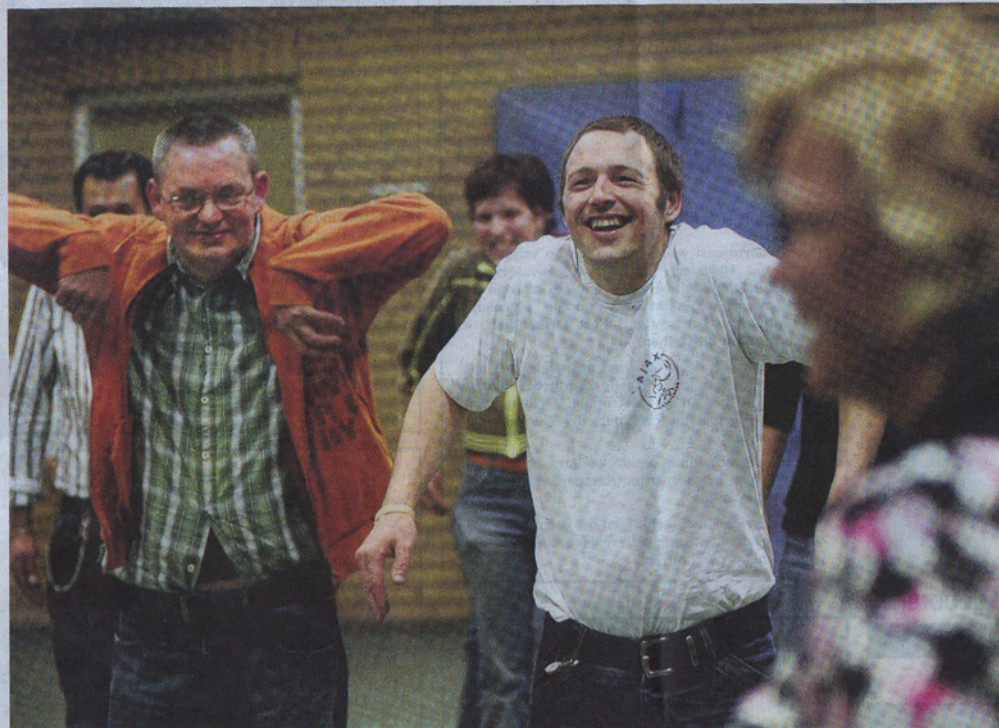
Leden van Animo bezig met een ontspanningsoefening in de Veghelse Franciscusschool. Stage Affairs gaat met deze groep een musical opvoeren in De Blauwe Kei: 'Land in zicht'. Hiervoor kregen zij een stimuleringsprijs van De Blauwe Kei.